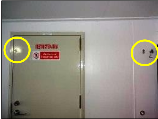
バックフックの装着