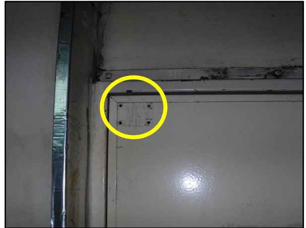
不適切な防火戸修理