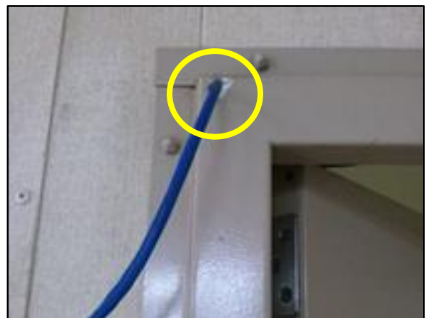
不適切なケーブル貫通