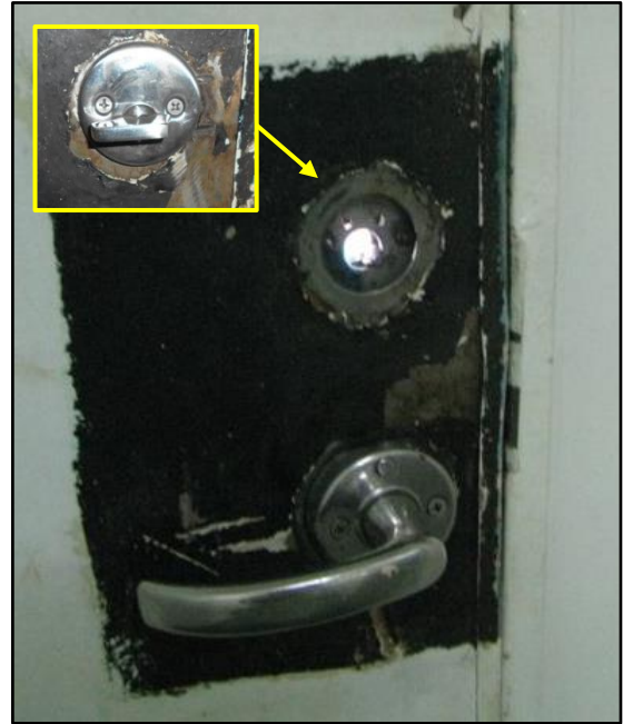
防火戸の鍵の脱落