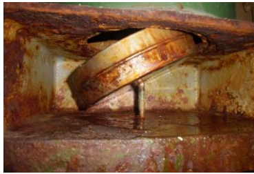
Post too short, disk slipped off