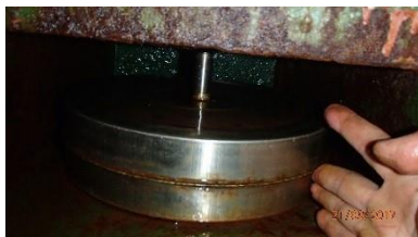
Broken Post/missing gasket