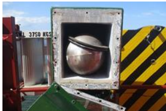
Gasket slipped off