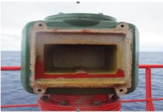
Missing disk and post

Examples of issues found are provided in the photographs below.