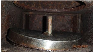
Warped Disk/Missing gasket

Examples of issues found are provided in the photographs below.