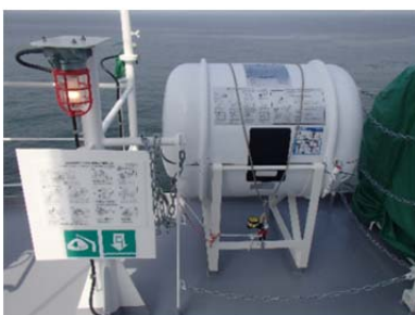
ダビット進水式の救命いかだ

救命いかだを新替える際には、今一度、整備業者等により手配された救命いかだが適切な型式かどうかをご確認願います。